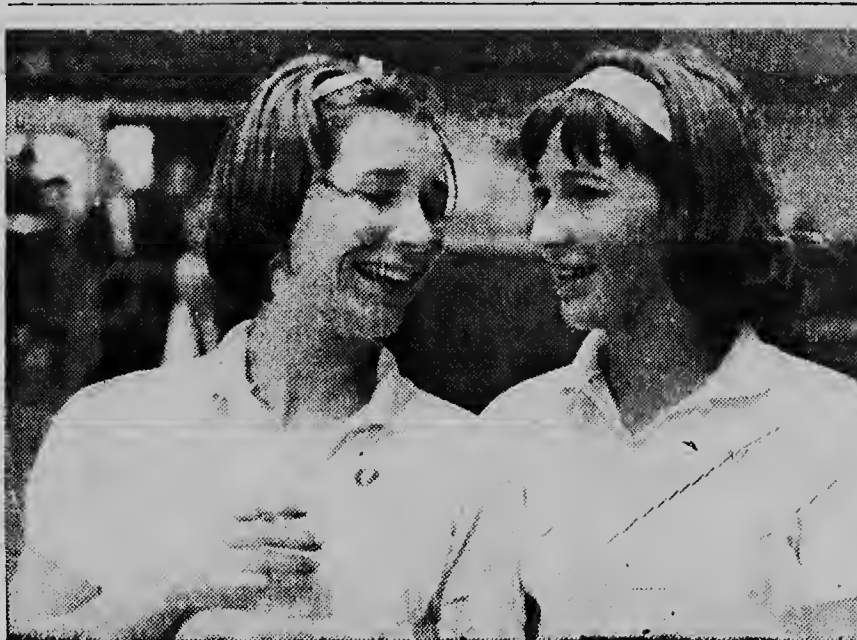
Na Haarlem e campeonatonan Hulandes di Badminton a tumo lugar. Den final a sali dos ruman...